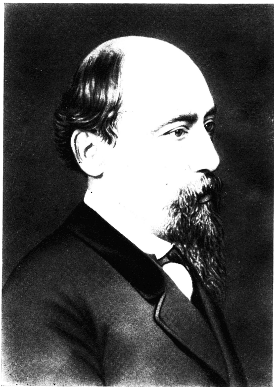
Н. А. НЕКРАСОВ Фотография 1870-х годов.